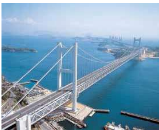
瀬戸大橋 Seto Ohashi Bridge