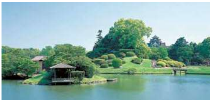
岡山城・後樂園 Okayama Castle, Korakuen Garden