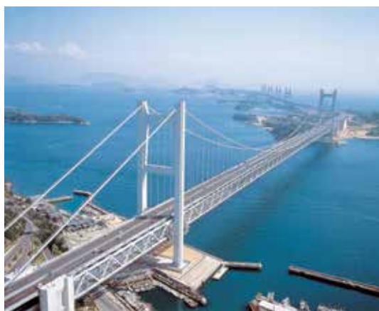
瀬戸大橋 Seto Ohashi Bridge