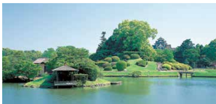
岡山城・後樂園 Okayama Castle, Korakuen Garden